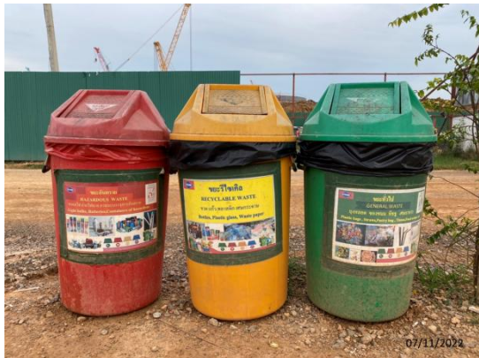
รูปที่ 3.1-39 การจัดการกากของเสีย บริเวณที่พักคนงานชั่วคราว