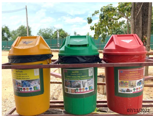
รูปที่ 3.1-23 ภาชนะรองรับมูลฝอยที่มีฝาปิดมิด