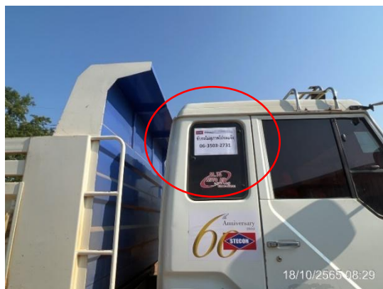
รูปที่ 3.1-25 การติดป้ายชื่อและเบอร์โทรศัพท์ลงบนรถขนส่ง