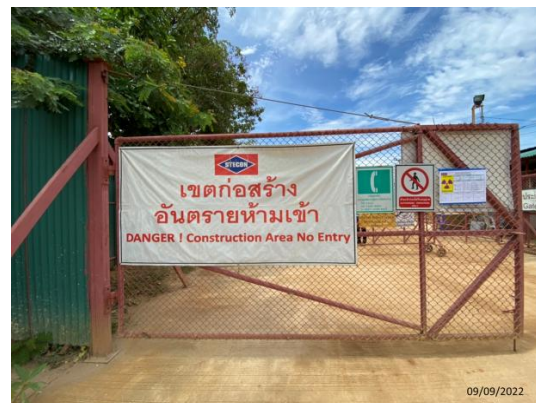
รูปที่ 3.1-31 ป้ายเตือนอันตรายบริเวณพื้นที่ก่อสร้าง

ภาพถ่ายประกอบการปฏิบัติตามมาตรการป้องกันและแก้ไขผลกระทบสิ่งแวดล้อม