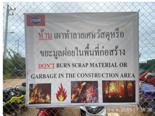
รูปที่ 3.1-11 ป้ายเตือนห้ามเผาทำลายเศษวัสดุ หรือขยะมูลฝอย

ภาพถ่ายประกอบการปฏิบัติตามมาตรการป้องกันและแก้ไขผลกระทบสิ่งแวดล้อม