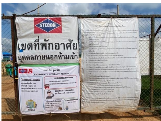
รูปที่ 3.1-42 การติดกฎระเบียบ บริเวณที่พักคนงานชั่วคราว