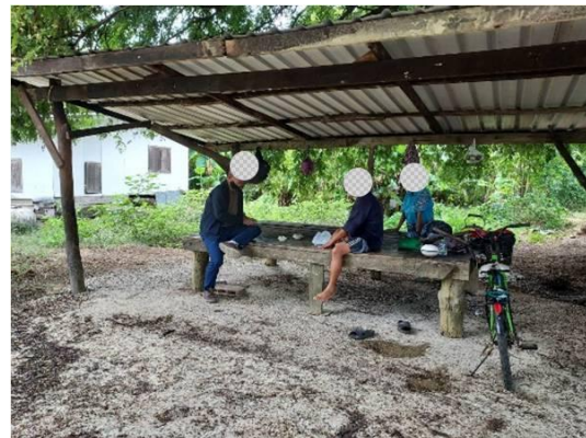
รูปที่ 3.1-3 ตัวอย่างการประชาสัมพันธ์โครงการ

ภาพถ่ายประกอบการปฏิบัติตามมาตรการป้องกันและแก้ไขผลกระทบสิ่งแวดล้อม