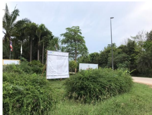
รูปที่ 3.1-2 ป้ายแสดงรายละเอียดโครงการ