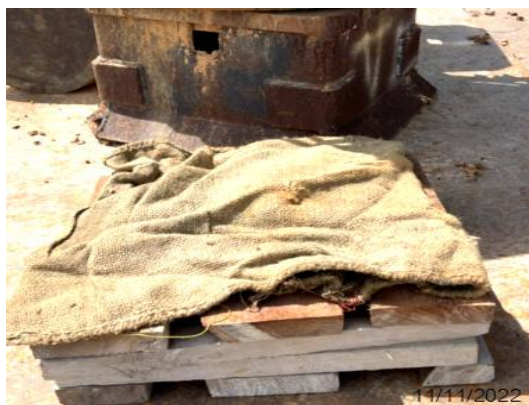
รูปที่ 3.1-14 ไม้หมอนและกระสอบรองหัวเสาเข็ม