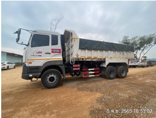
รูปที่ 3.1-6 การใช้ผ้าใบคลุมรถบรรทุก วัสดุอุปกรณ์การก่อสร้าง