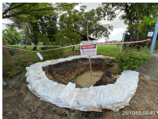
รูปที่ 3.2-23 อุปกรณ์ในการกั้นพื้นที่

ภาพถ่ายประกอบการปฏิบัติตามมาตรการป้องกันและแก้ไขผลกระทบสิ่งแวดล้อม สำหรับการวางท่อส่งน้ำดิบและท่อน้ำทิ้งของโครงการโรงไฟฟ้าหินกอง ระยะก่อสร้าง บริษัท หินกองเพาเวอร์ จำกัด