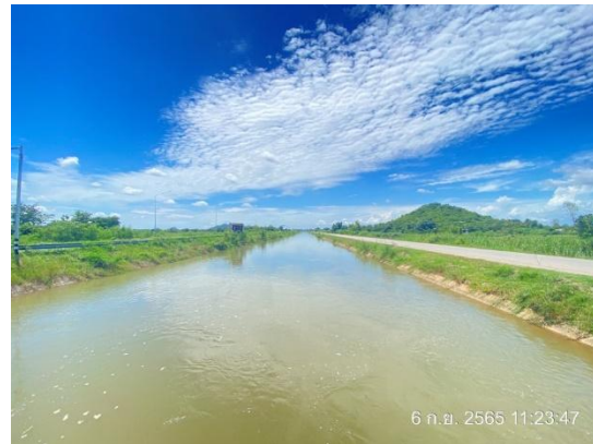
รูปที่ 3.1-17 น้ำใช้ภายในพื้นที่โครงการ