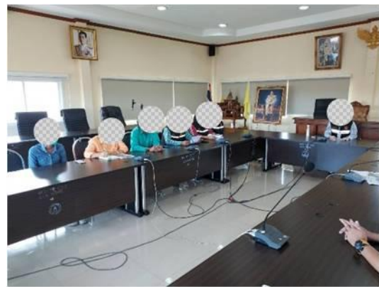
รูปที่ 3.1-3 ตัวอย่างการประชาสัมพันธ์โครงการ (ต่อ)