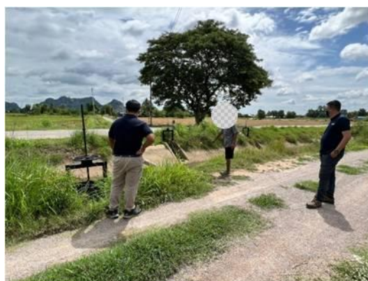
รูปที่ 3.2-7 ตัวอย่างการประชาสัมพันธ์โครงการ

ภาพถ่ายประกอบการปฏิบัติตามมาตรการป้องกันและแก้ไขผลกระทบสิ่งแวดล้อม สำหรับการวางท่อส่งน้ำดิบและท่อน้ำทิ้งของโครงการโรงไฟฟ้าหินกอง ระยะก่อสร้าง บริษัท หินกองเพาเวอร์ จำกัด