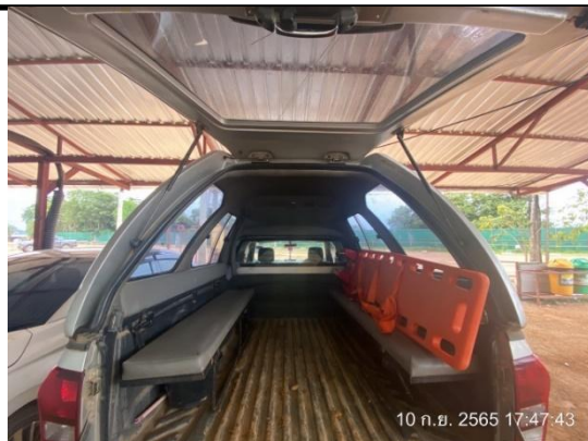
รูปที่ 3.1-35 รถรับส่งกรณีเกิดเหตุฉุกเฉิน