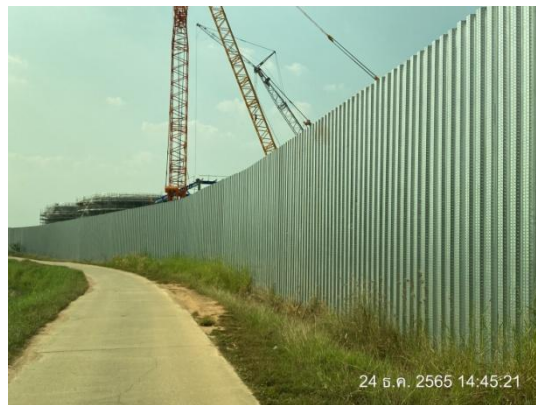
รูปที่ 3.1-30 ขอบเขตพื้นที่และแนวรั้วบริเวณพื้นที่ก่อสร้าง