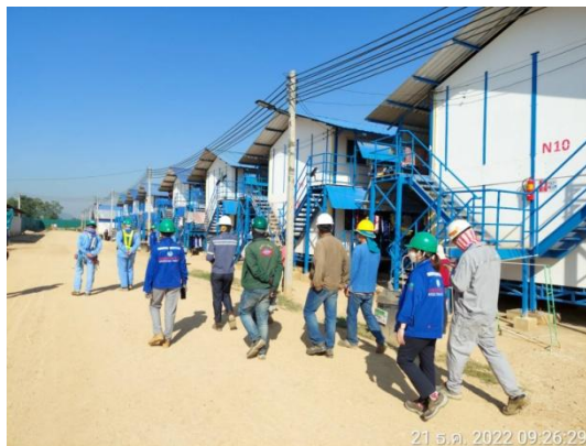
รูปที่ 3.1-40 การตรวจติดตามที่พักคนงาน ชั่วคราว