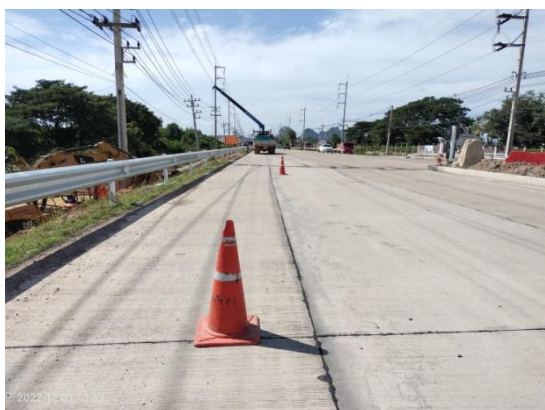
รูปที่ 3.2-17 กรวยยางก่อนถึงพื้นที่ก่อสร้าง