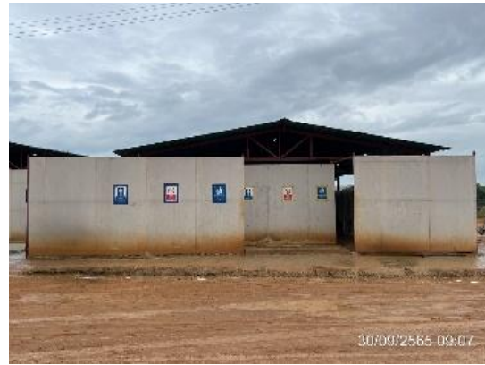
รูปที่ 3.1-19 ห้องสุขาที่มีถังเก็บสิ่งปฏิกูล และถูกสุขลักษณะ