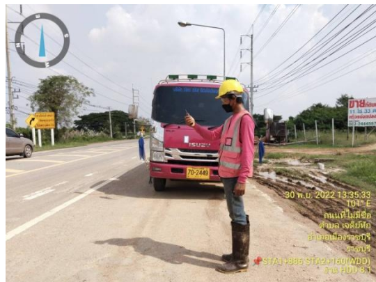
รูปที่ 3.2-22 พนักงานติดตามดูแลตามแนวท่อ