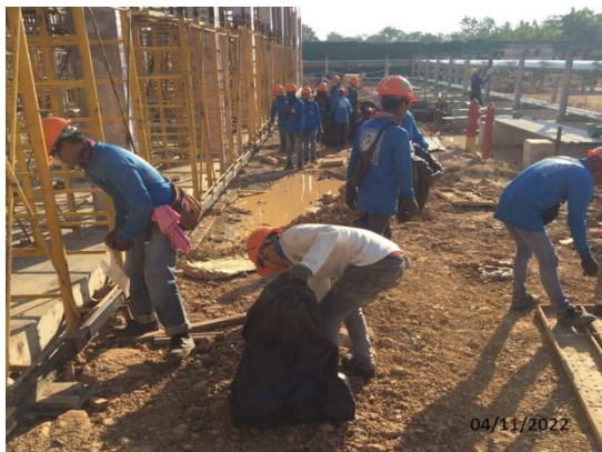
รูปที่ 3.1-12 การเก็บกวาดทำความสะอาดเศษวัสดุ และกากของเสียในพื้นที่ก่อสร้าง