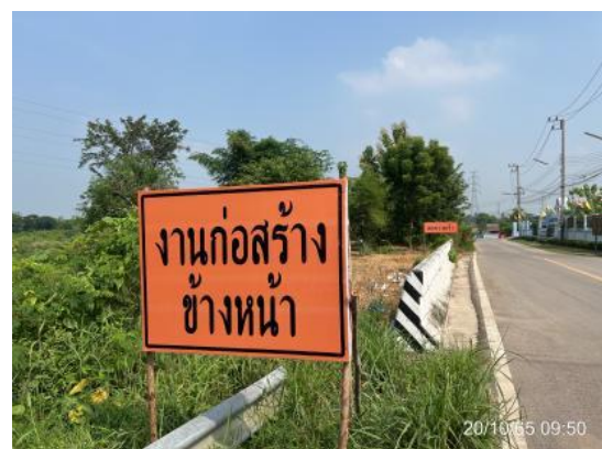
รูปที่ 3.2-15 ป้ายงานก่อสร้างก่อนถึงพื้นที่ก่อสร้าง

ภาพถ่ายประกอบการปฏิบัติตามมาตรการป้องกันและแก้ไขผลกระทบสิ่งแวดล้อม สำหรับการวางท่อส่งน้ำดิบและท่อน้ำทิ้งของโครงการโรงไฟฟ้าหินกอง ระยะก่อสร้าง บริษัท หินกองเพาเวอร์ จำกัด