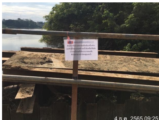
รูปที่ 3.2-12 ป้ายเตือนห้ามล้าง/ทำความสะอาดเครื่องมือ/เครื่องจักร และห้ามทิ้งขยะสารเคมี และน้ำมันเครื่องใช้แล้วลงแหล่งน้ำ