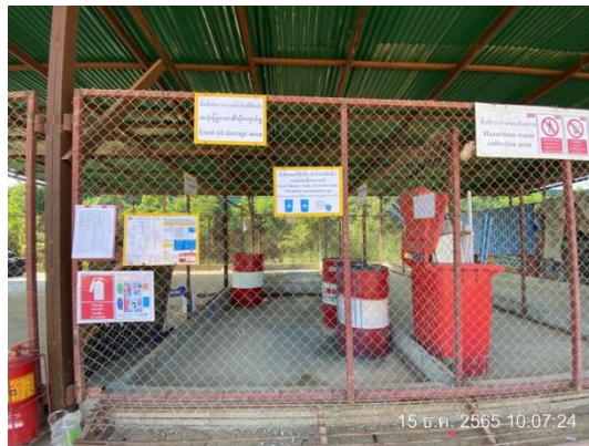
รูปที่ 3.1-24 พื้นที่รวบรวมกากของเสียแยกประเภท พร้อมป้ายระบุชนิดเงิน

ภาพถ่ายประกอบการปฏิบัติตามมาตรการป้องกันและแก้ไขผลกระทบสิ่งแวดล้อม