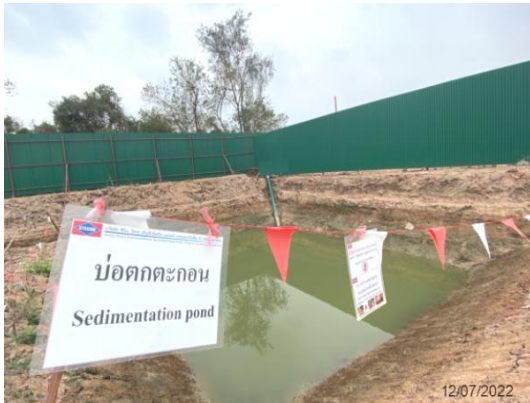
รูปที่ 3.1-28 บ่อดักตะกอนน้ำชั่วคราว ภายในพื้นที่โครงการ