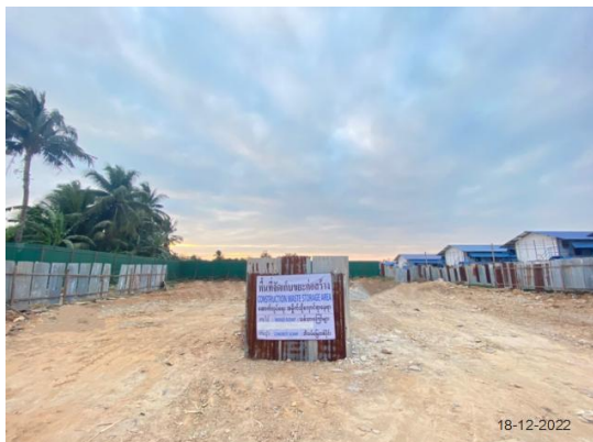
รูปที่ 3.1-22 พื้นที่จัดเก็บวัสดุก่อสร้าง