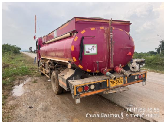
รูปที่ 3.2-21 รถดูด