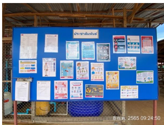
รูปที่ 3.1-36 การให้ความรู้เกี่ยวกับสุขอนามัย