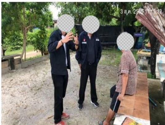
รูปที่ 3.2-5 การเข้าหาหรือเจ้าของบ้านหรือร้านค้าเพื่อวางแผนช่วงเวลาก่อสร้าง