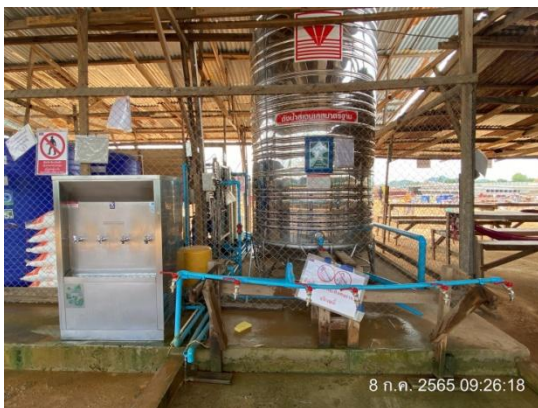
รูปที่ 3.1-18 น้ำดื่มสะอาดสำหรับคนงาน