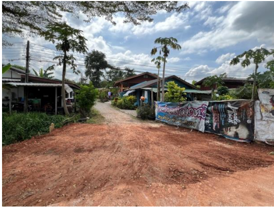
รูปที่ 3.2-1 การฝังกลบเมื่อวางท่อส่งน้ำดิบและท่อน้ำทิ้งแล้วเสร็จ