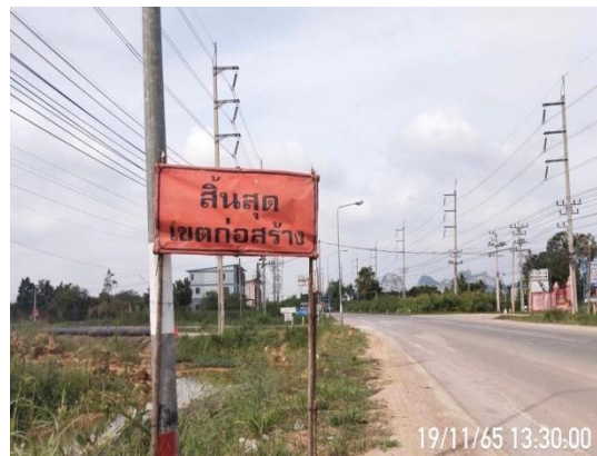
รูปที่ 3.2-18 ป้ายสุดเขตก่อสร้าง