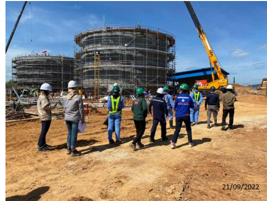
รูปที่ 3.1-29 การตรวจสอบสภาพความ ปลอดภัยในการทำงานของคานงาน