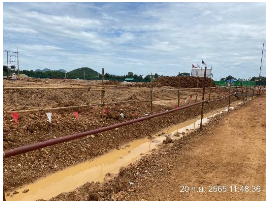
รูปที่ 3.1-27 รางระบายน้ำภายในพื้นที่โครงการ

ภาพถ่ายประกอบการปฏิบัติตามมาตรการป้องกันและแก้ไขผลกระทบสิ่งแวดล้อม