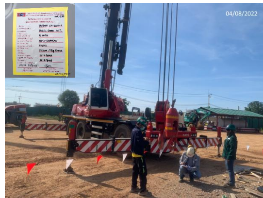
รูปที่ 3.1-9 สติ๊กเกอร์แสดงการตรวจสอบ เครื่องจักร