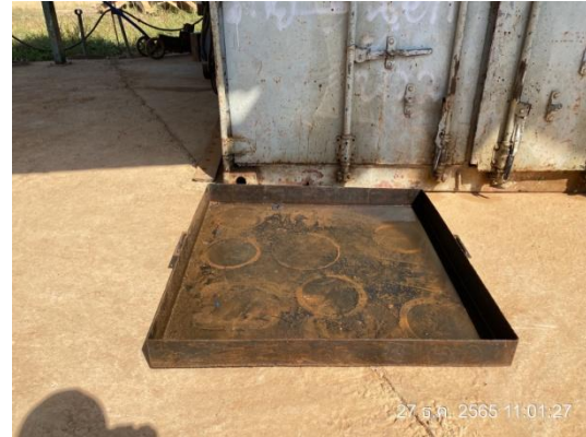
รูปที่ 3.1-44 พื้นที่ซ่อมบำรุงเครื่องจักร