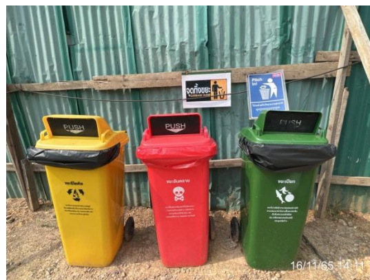
รูปที่ 3.2-20 ภาพขณะรองรับขยะมูลฝอย จำแนกตามประเภทที่มีฝาปิดมิด

ภาพถ่ายประกอบการปฏิบัติตามมาตรการป้องกันและแก้ไขผลกระทบสิ่งแวดล้อม สำหรับการวางท่อส่งน้ำดิบและท่อน้ำทิ้งของโครงการโรงไฟฟ้าหिनกอง ระยะก่อสร้าง บริษัท หินกองเพาเวอร์ จำกัด