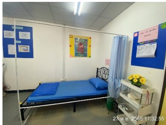
รูปที่ 3.1-34 ห้องพยาบาล อุปกรณ์ปฐมพยาบาลเบื้องต้น และเวชภัณฑ์พื้นฐาน

ภาพถ่ายประกอบการปฏิบัติตามมาตรการป้องกันและแก้ไขผลกระทบสิ่งแวดล้อม