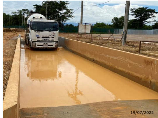
รูปที่ 3.1-7 การทำความสะอาดล้อรถบรรทุก ก่อนออกจากบริเวณพื้นที่ก่อสร้าง