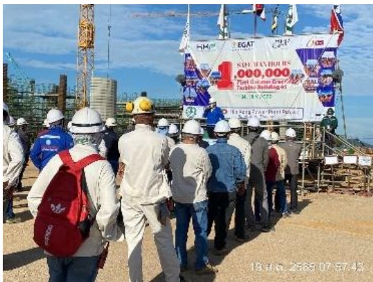
รูปที่ 3.1-10 การประชุมก่อนเริ่มทำงาน (Tool Box Talk Meeting)