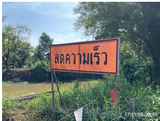
รูปที่ 3.2-16 ป้ายลดความเร็วก่อนถึงพื้นที่ก่อสร้าง