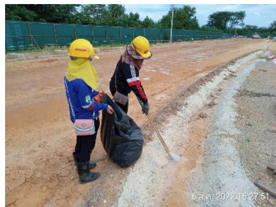
รูปที่ 3.1-21 การตรวจสอบและทำความสะอาด รางระบายน้ำ

ภาพถ่ายประกอบการปฏิบัติตามมาตรการป้องกันและแก้ไขผลกระทบสิ่งแวดล้อม โครงการโรงไฟฟ้าหินกอง ระยะก่อสร้าง บริษัท หินกองเพาเวอร์ จำกัด