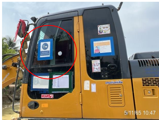
รูปที่ 3.2-9 ป้ายเตือนดับเครื่องยนต์