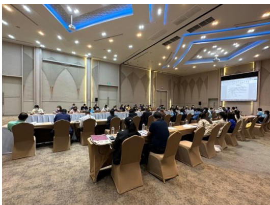
รูปที่ 3.1-47 การประชุมคณะผู้ตรวจการสิ่งแวดล้อม