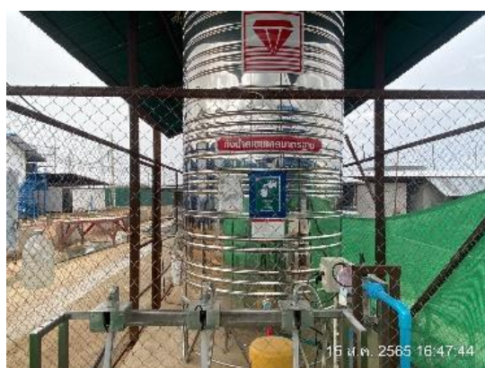
รูปที่ 3.1-38 น้ำดื่ม-น้ำใช้ บริเวณที่พักคนงานชั่วคราว

ภาพถ่ายประกอบการปฏิบัติตามมาตรการป้องกันและแก้ไขผลกระทบสิ่งแวดล้อม