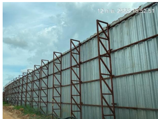
รูปที่ 3.1-13 กำแพงกันเสียงชั่วคราวบริเวณบ้าน หลังโรงไฟฟ้า (ด้านทิศใต้ของโครงการ)