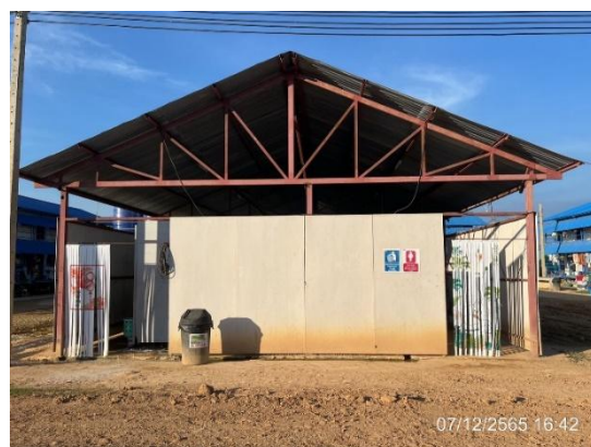
รูปที่ 3.1-37 ห้องน้ำ-ห้องส้วม บริเวณที่พักคนงานชั่วคราว