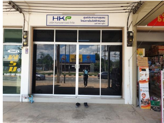
รูปที่ 3.1-1 ศูนย์รับเรื่องร้องเรียน