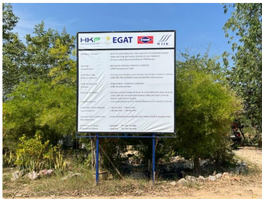
รูปที่ 3.2-6 ป้ายแสดงรายละเอียดโครงการ