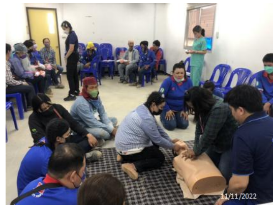
รูปที่ 3.1-46 การอบรมปฐมพยาบาลเบื้องต้น (First Aid)