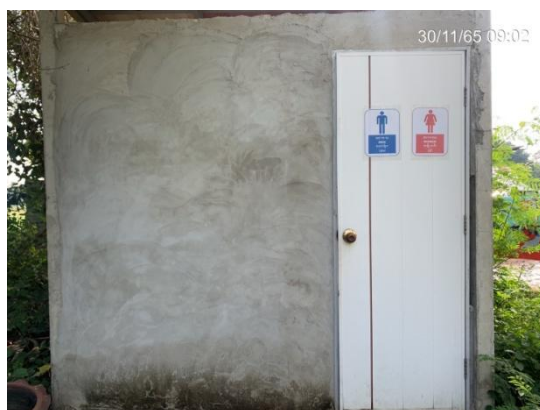
รูปที่ 3.2-11 ห้องสุขาบริเวณที่พักคนงานชั่วคราว