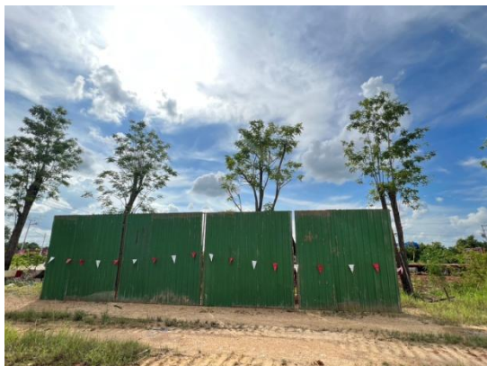
รูปที่ 3.2-8 กำแพงกันเสียงชั่วคราว