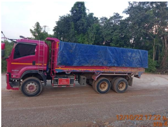
รูปที่ 3.2-3 การปิดคลุมวัสดุในการก่อสร้างเมื่อมีการขนย้าย