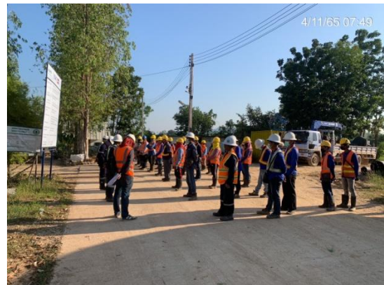
รูปที่ 3.2-4 การประชุมก่อนเริ่มทำงาน (Tool Box Talk Meeting)