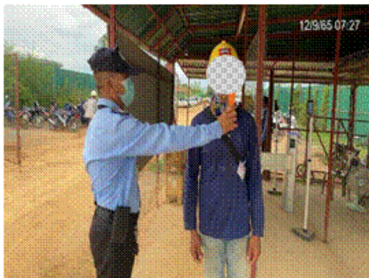
รูปที่ 3.1-41 การสุ่มตรวจสิ่งเสพติดและแอลกอฮอล์