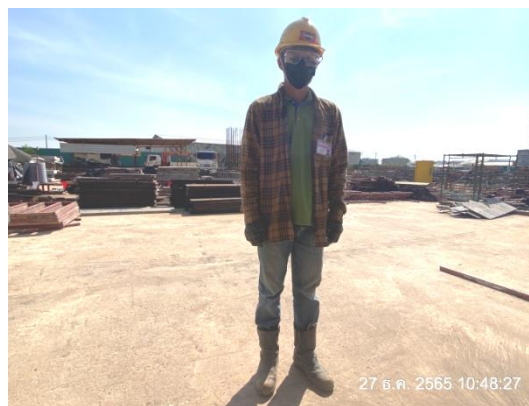
รูปที่ 3.1-33 คนงานสวมใส่อุปกรณ์ป้องกันอันตรายส่วนบุคคล