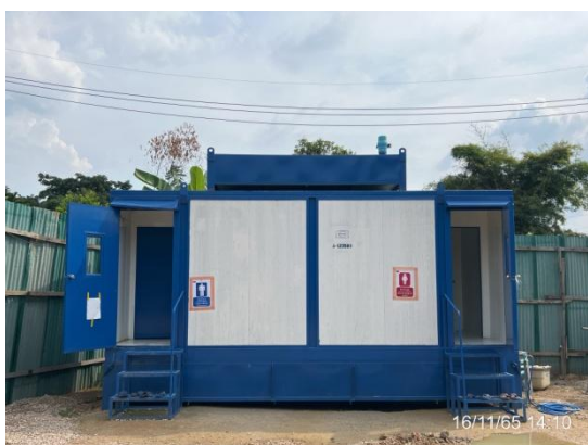
รูปที่ 3.2-10 ห้องสุขาชั่วคราวบริเวณสำนักงาน