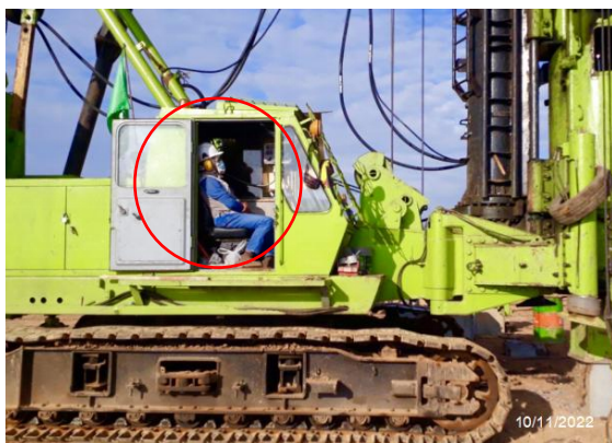
รูปที่ 3.1-15 คนงานสวมใส่อุปกรณ์ป้องกันเสียง