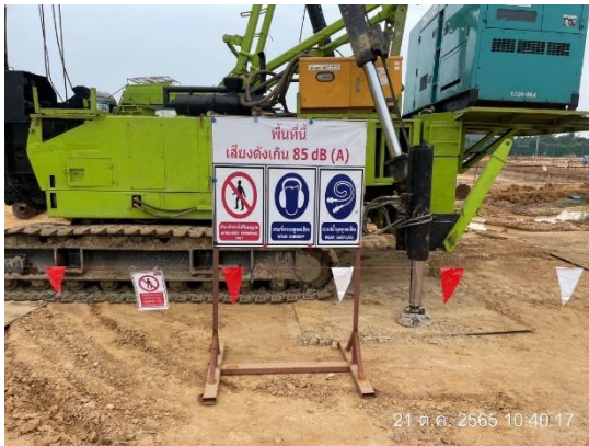
รูปที่ 3.1-16 ป้ายสัญลักษณ์ให้สวมใส่อุปกรณ์ ป้องกันเสียงบริเวณที่มีเสียงดัง