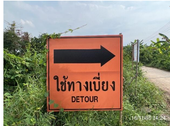
รูปที่ 3.2-14 ป้ายใช้ทางเบี่ยง