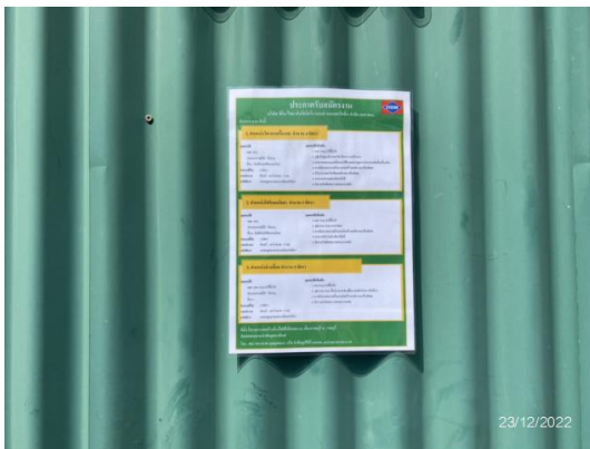
รูปที่ 3.1-45 การติดประกาศการรับสมัครงาน