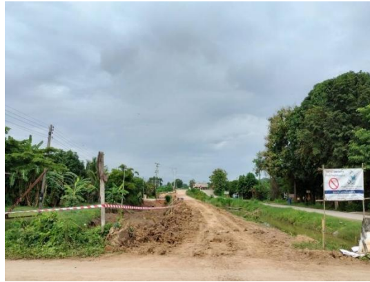
รูปที่ 3.2-13 การเก็บกองดิน