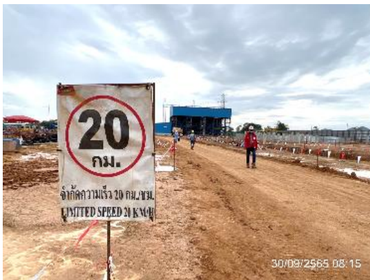
รูปที่ 3.1-8 ป้ายจำกัดความเร็วรถ ไม่เกิน 20 กิโลเมตรต่อชั่วโมง