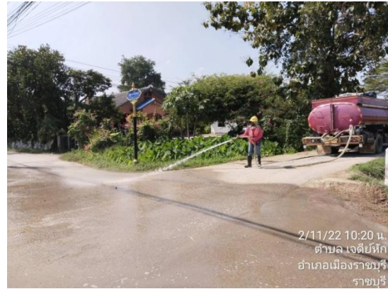
รูปที่ 3.2-2 การฉีดพรมน้ำบริเวณการวางท่อส่งน้ำดิบและท่อน้ำทิ้ง