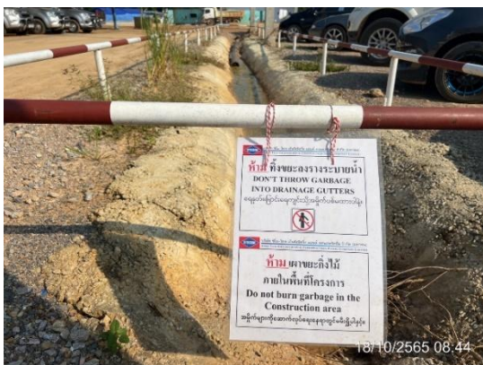
รูปที่ 3.1-20 ป้ายห้ามทิ้งขยะมูลฝอย ลงรางระบายน้ำ