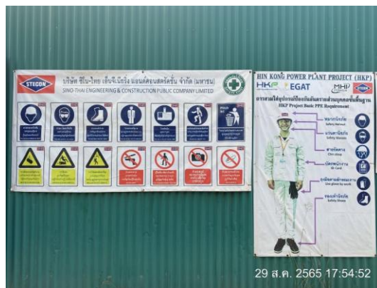
รูปที่ 3.1-32 ป้ายเตือนสวมใส่อุปกรณ์ป้องกันอันตรายส่วนบุคคล