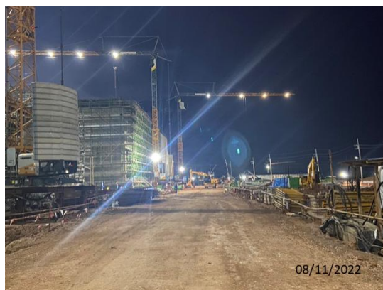
รูปที่ 3.1-43 ไฟส่องสว่างขณะปฏิบัติงานกลางคืน

ภาพถ่ายประกอบการปฏิบัติตามมาตรการป้องกันและแก้ไขผลกระทบสิ่งแวดล้อม